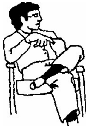
Rys. 3. Gest wskazujący obiekt konkretny lub wyobrażony (istniejący mentalnie) 25 .