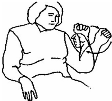
Rys. 1 Gest ikoniczny: ręka wydaje się krążyć za obiektem w powietrzu 23 (przykłady z książki D. McNeill'a).