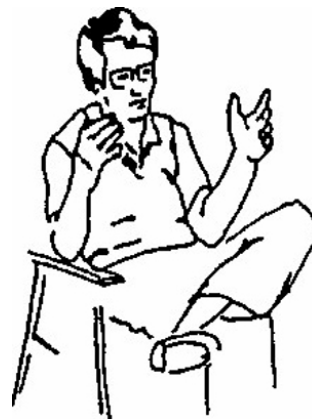
Rys. 2 Gest metaforyczny: Ręce wznoszą się i przedstawiają słuchaczowi obiekt (zależność przestrzenna) 24 .

indywidualnego podmiotu. Podstawową cechą metafor gestualnych jest to, że ich obrazowa zawartość przedstawia abstrakcyjną ideę, np.: gesty kreślące w powietrzu kształt przedmiotu lub oddające ruch, gesty definiujące zależności przestrzenne między przedmiotami;